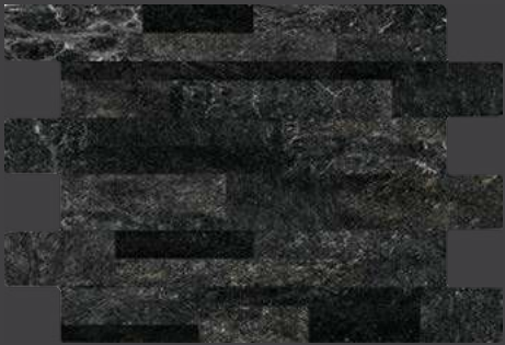
BLACK GSN3 34 X 50 cm