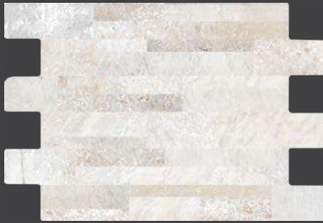
GOLD GSN1 34 X 50 cm