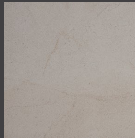
Crema GSZ1 60.5 X 60.5 cm 60 X 60 cm rectificado