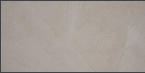
Crema GSZ1 45 X 90 cm 45 X 90 cm rectificado