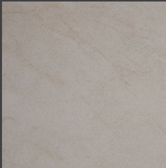
Crema GSZ1 75 X 75 cm 75 X 75 cm rectificado