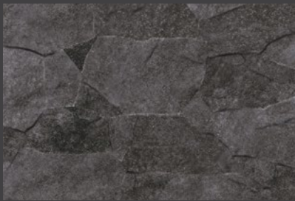
Grafito ZVL8 30 X 45 cm