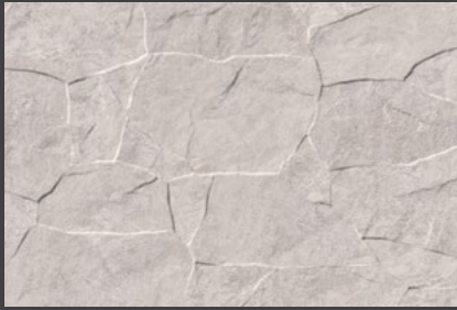
Beige ZVL6 30 X 45 cm