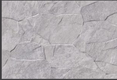
Gris ZVL7 30 X 45 cm